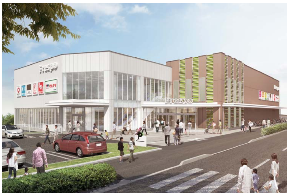
完成予想パース ※イメージであり実際とは異なる場合があります。

「フレスポ」とは《フレンドリースポット》の略称で、「日常生活に便利なショッピングセンター」をコンセプトに展開しています。当社が開発する複合商業施設としては、兵庫県内で6ヶ所目となります。（①センチュリーガーデンフレスポ、②ブランチ神戸学園都市、③玉津商業施設、④フレスポ赤穂、⑤B i V i 土山）