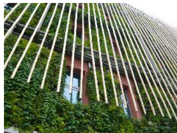
▲上海万博のローヌ＝アルプ館