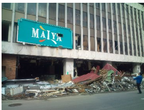
被災したマイヤ本店