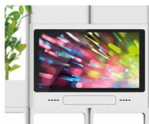
⑤ディスプレイ機能