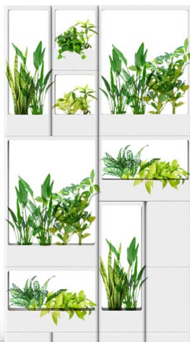
「i.G (アイジー)」モデルプラン

「i.G」とは「interior (インテリア)」・「intelligent (インテリジェント)」・「idea (アイデア)」の3つの頭文字の「i」と「Green (グリーン)」の頭文字の「G」を組み合わせせた造語。