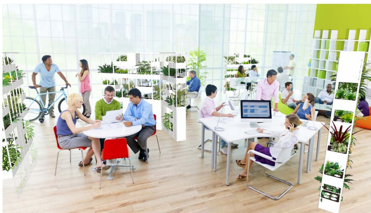
「i.G」設置室内イメージパース