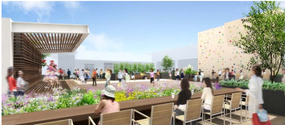
「森の広場」イメージ