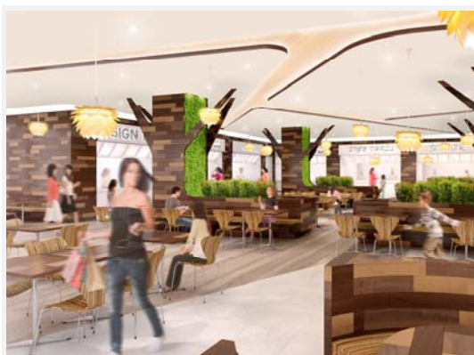
『森のダイニング』イメージ（昼間）