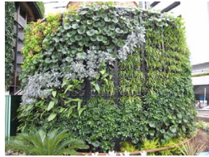
【1階「大阪マルビル 緑のテラス」の緑化のようす】