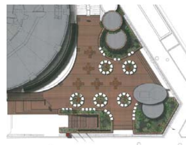
【「大阪マルビル 緑のテラス (480 m²)」の配置図】

広場内には、大和リースとライセンス契約を締結しているフランスの緑化会社 カネヴァフロール社製の壁面緑化システムに、アイビーをはじめ、オタフクナンテン、カボックなど約20種類・約2,600ポット（鉢）の植物を用いて、全長16m・高さ2.5m・40m 2 と全長10.5m・高さ2.85m・30m 2 の巨大な緑の壁に配置し、意匠性の高い壁面を演出。緑あふれるオープンな空間を創りました。