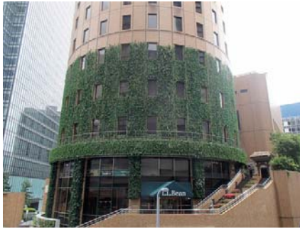
【1階から6階の壁面緑化のようす】