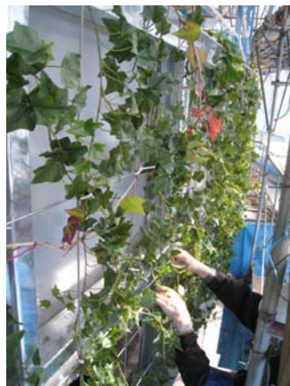
【ビル壁面の緑化工事の様子】