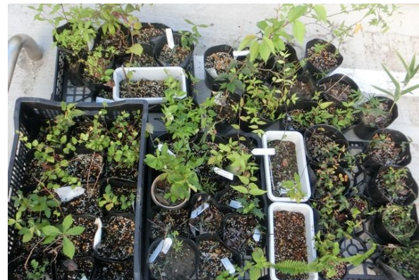
地域在来の植物苗木を育成