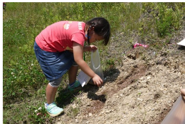
在来の野草のタネまきや外来植物の駆除イベントを実施