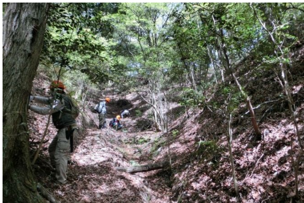
近隣の里地里山から地域在来の植物のタネや実生を集めています