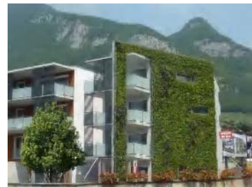
▲スイス・エイグル