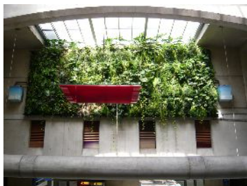
▲パリ市地下鉄マジェンタ駅構内