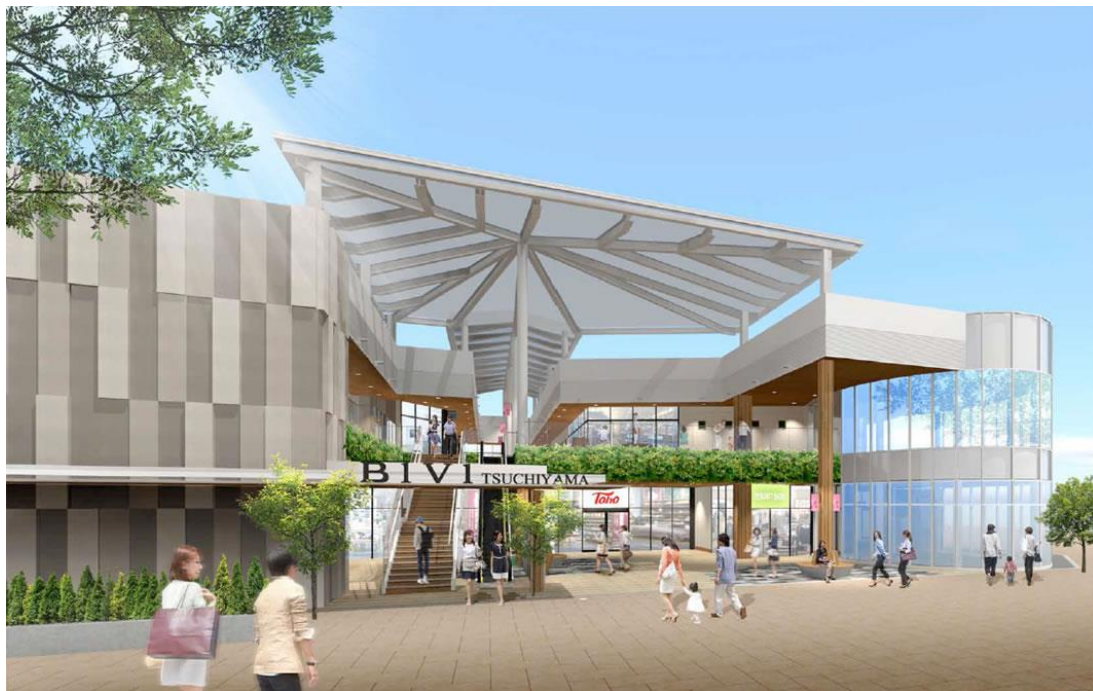
※イメージであり、実際とは異なる場合があります。

BiVi 土山は、地域の新しい交流の場として駅周辺のさらなるにぎわいづくりを目指します。