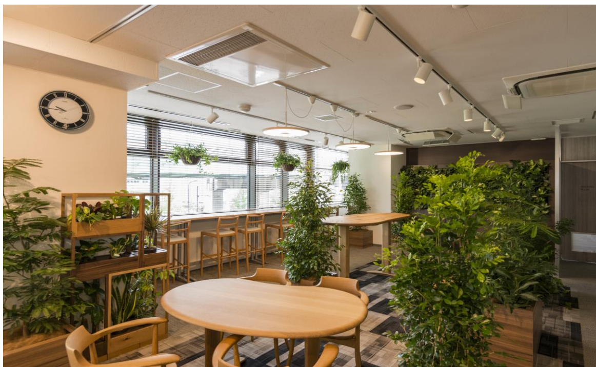
ヴェルデニア設置例（大和リース本社）

通常のデスクワークで使用する家具とは違い、上質な木製家具を配置することで気分転換を促進します。