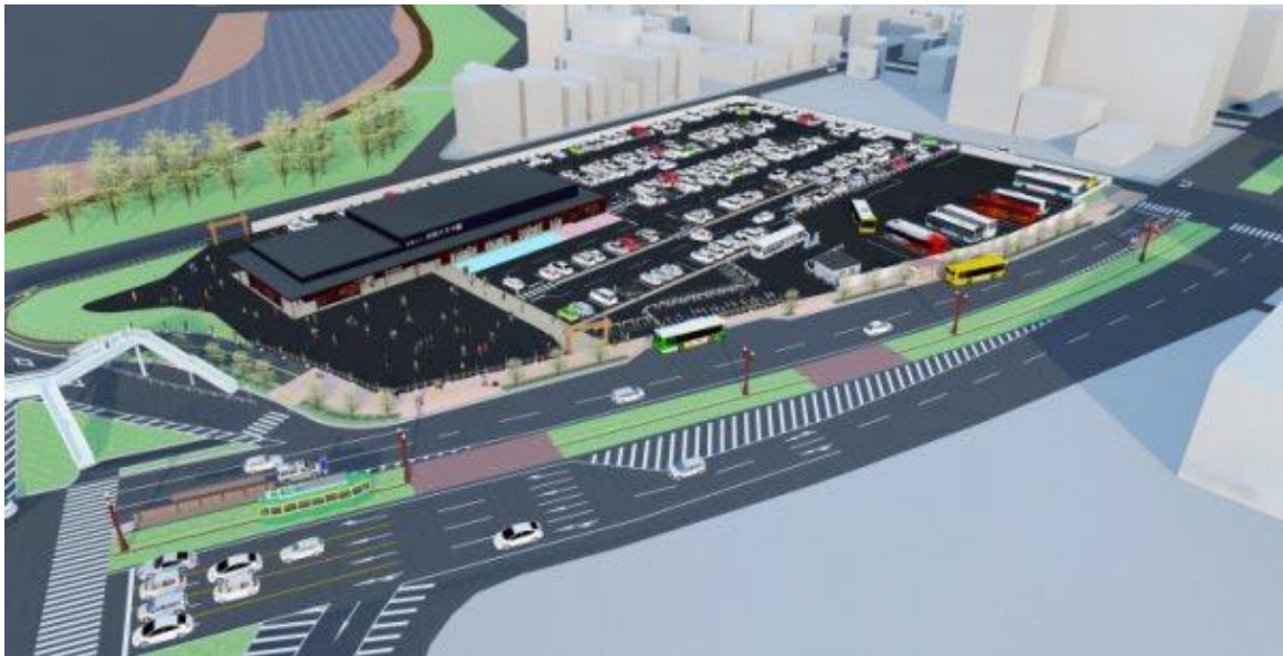
完成パース ※イメージであり実際とは異なる場合があります。