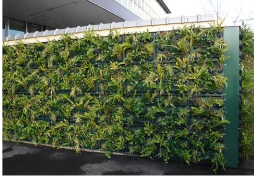
施設外周壁面に設置の「D's グリーンパレット」

D's グリーンパレットは 2018 年 4 月に発売開始した商品で、当社従来商品より薄型の壁面緑化システムとなります。湿潤時 30kg/m 2 と軽量なため、建物への負担を減らすことが可能。植物を事前養生するため、施工直後でも緑豊かな壁面を演出できます。