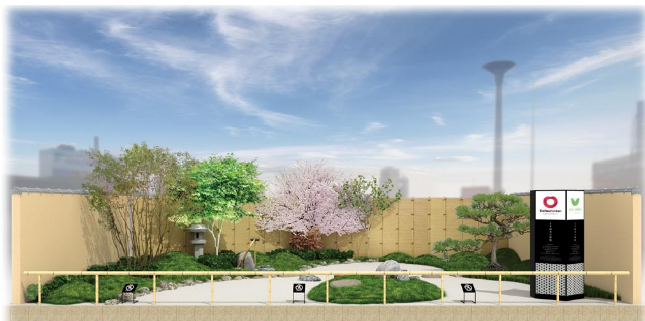
完成予想パース ※イメージであり実際とは異なる場合があります。

リニューアルする施設では、国内・海外から来阪される方々に都市の中で潤いを感じていただける待ち合わせのツーリストスポットを目指しています。