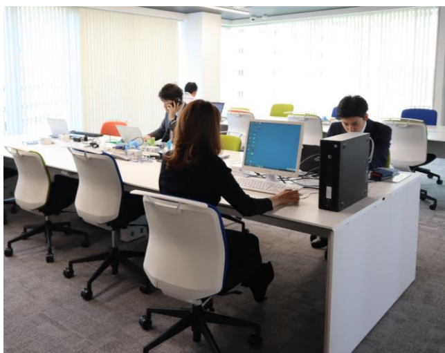
オープンスペース