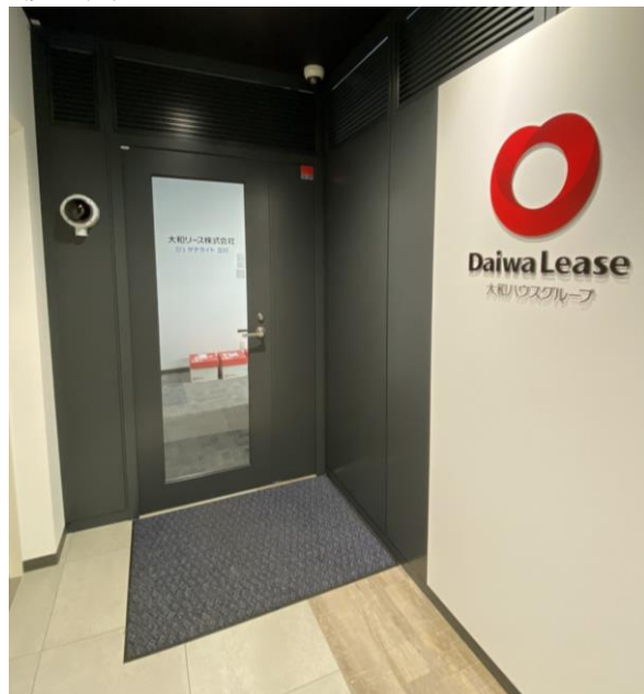
D's サテライト立川 入口