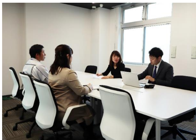
ミーティングルーム