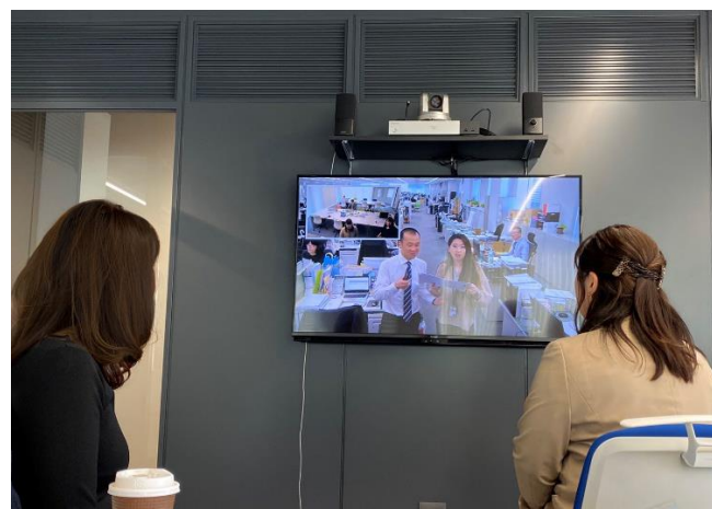
マザーオフィスと常時接続のモニター