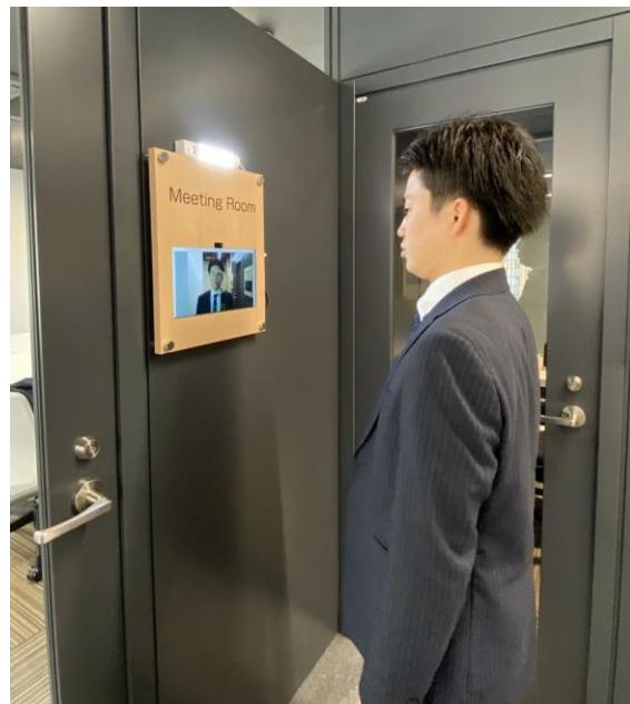
顔認証での入室の様子