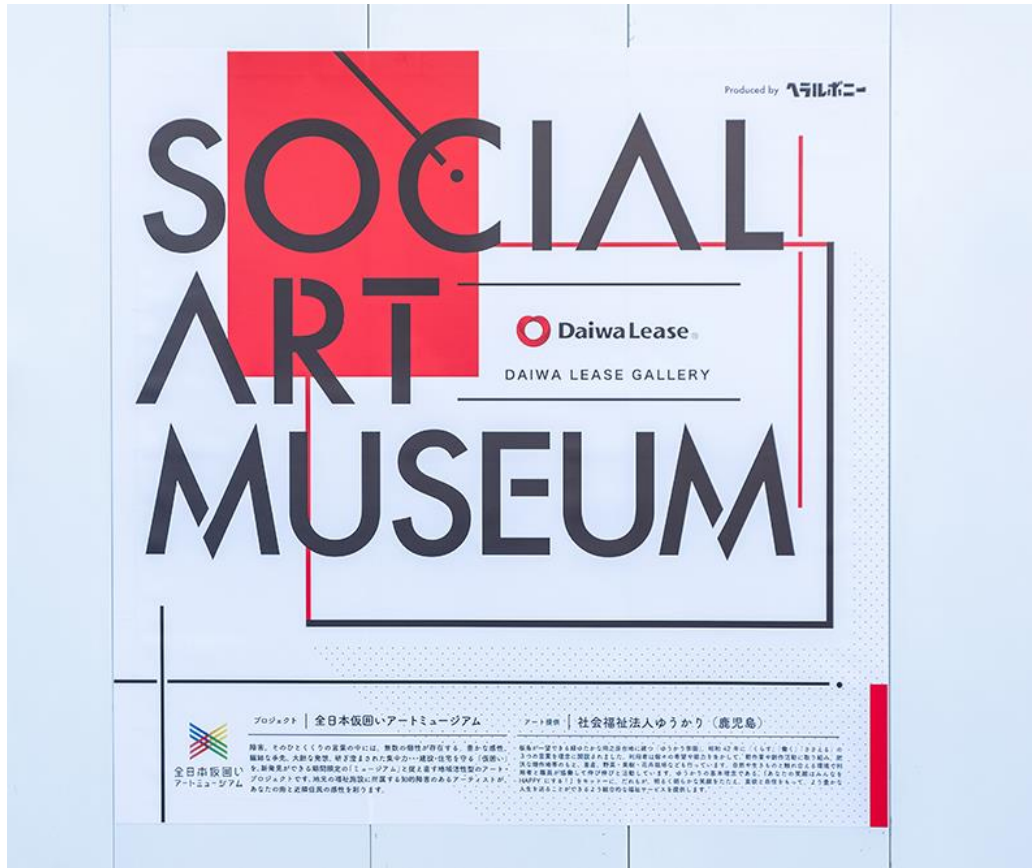
大和リースの建設現場に設置している「全日本仮囲いアートミュージアム」案内パネル

大和リースの建設現場にて、年間 5、6 現場（1 現場 4～8 作品）の仮囲いにヘラルボニーがアート作品を展示します。