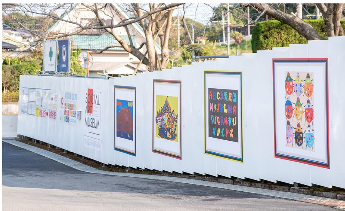
鹿児島県内にて、大和リースが施工する建設現場（福祉施設）の仮囲いに展示しているアート作品

ヘラルボニーは障害のある人が地域でその人らしい働き方を選択する機会が限られているという社会課題に対し、障害のある作家が描いた作品をライセンスとして展開することで新しい働き方の機会を地域で創出しています。大和リースは福祉施設建設などさまざまな事業を行うなかで、建設現場の仮囲いをアートで彩り、障害のある作家の個性や才能を地域住民に発信する場として活用するヘラルボニーの取り組みに賛同し、協定締結に至りました。今後、地域に根ざした働く機会の創出を目指し、両者で取り組みます。大和リースは今後3年間で全国のさまざまな建設現場の仮囲いに計100作品の展示を行います。