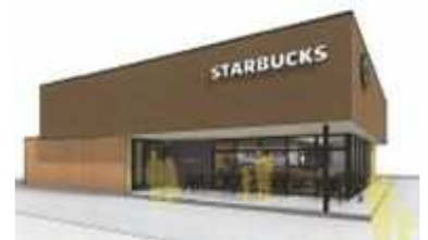
スターバックスコーヒー 店舗イメージ