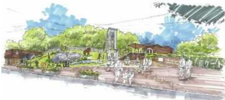
エントランス施設イメージ