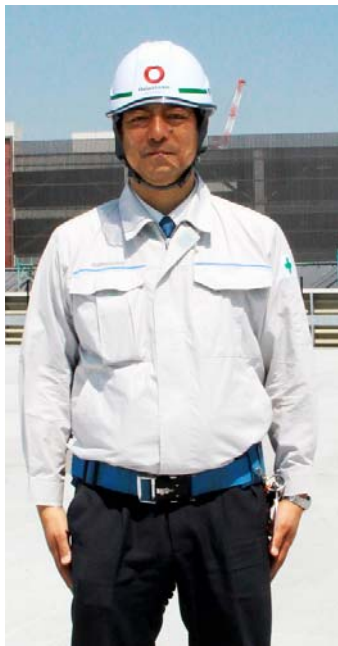
大和リース社員用