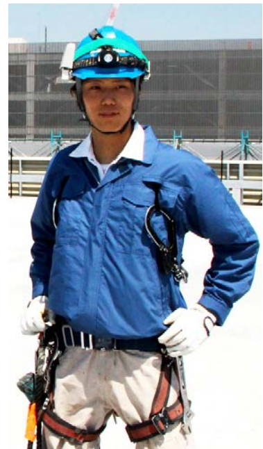
作業員用フルハーネス※2仕様