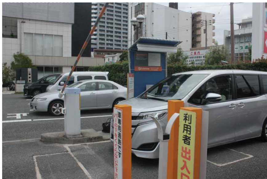
シェアゲート体験の様子

実際にスマートフォンを使用し、端末にBluetoothで接続してのゲートの開閉や、テンキーによるゲートの開閉を体験していただきました。