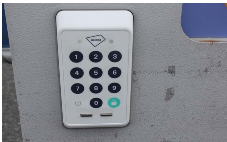
新しいシェアゲート端末

※こちらは今回のシェアゲート体験会時のみ特別に設置しております。現在は従来のもので設置しております