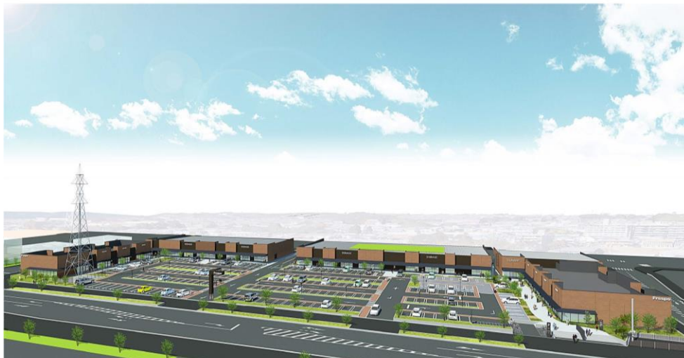
完成予想パース ※イメージであり実際とは異なる場合があります。

当社が開発する複合商業施設としては、仙台市内で7ヶ所目となります。（①BiVi 仙台駅東口、②フレスポ六丁の目南町、③フレスポ六丁の目、④ブランチ仙台、⑤bp town、⑥仙台市市名坂商業施設）