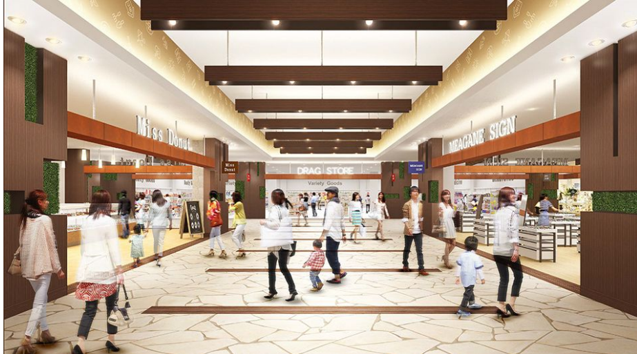
施設内イメージ（※イメージであり実際とは異なる場合があります。）