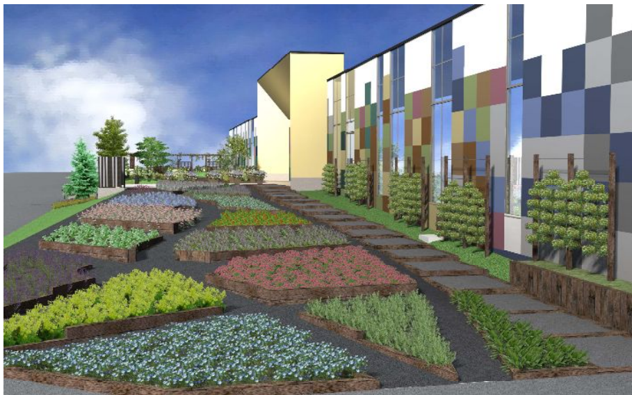
ガーデンスペースイメージ（※花や野菜が植えられ、庭が完成した場合のイメージです。）