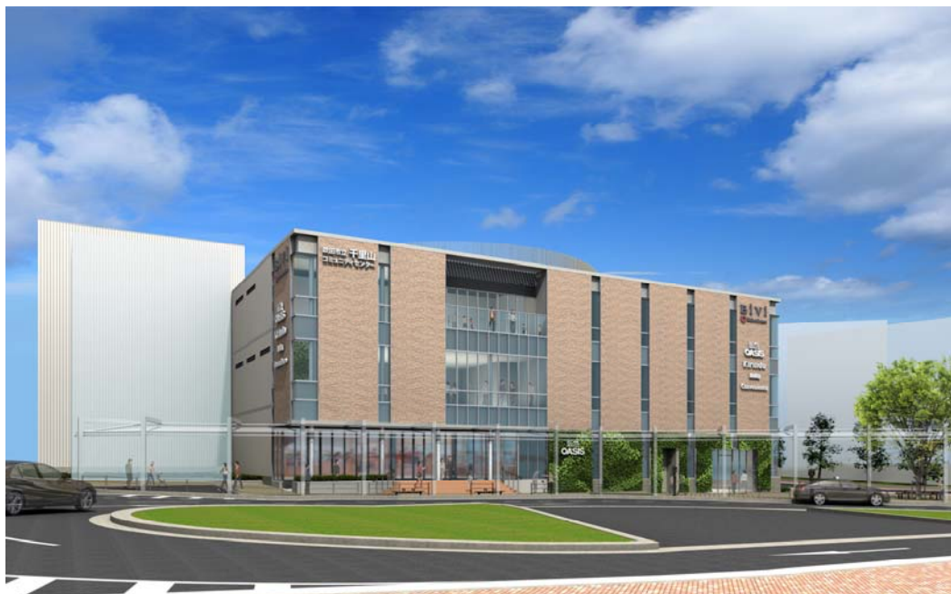
外観パース ※イメージであり実際とは異なる場合があります。

BiVi 千里山では、公共施設と日常買いまわり品を扱う店舗を充実させ、誰もが気軽に利用できる地域に根差した安全、安心、快適な商業施設として、駅周辺のにぎわいづくりを目指します。