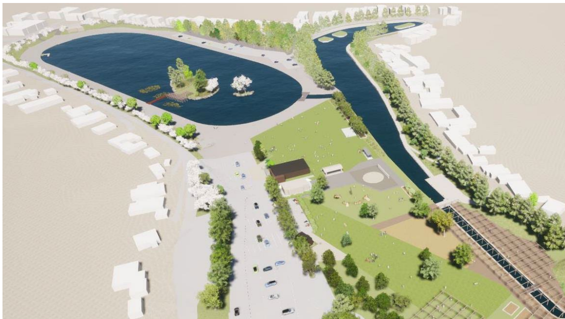
完成予想パース ※イメージであり実際とは異なる場合があります。