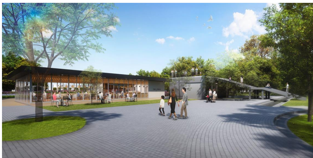
ベーカリーカフェ、パークセンター整備イメージ