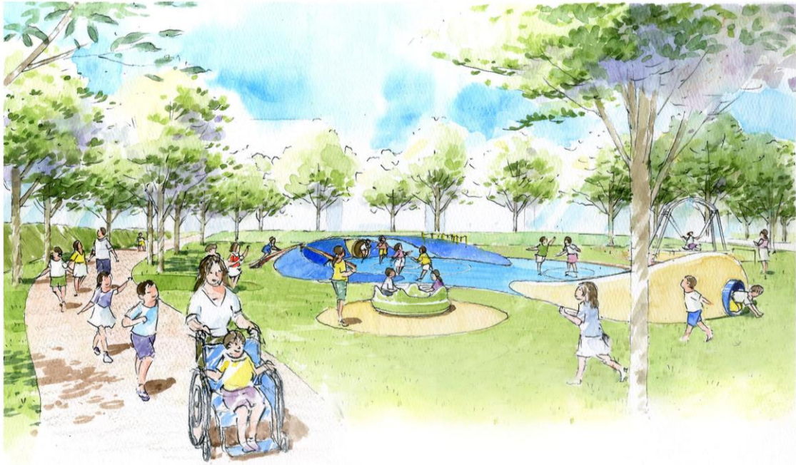
遊具整備イメージ