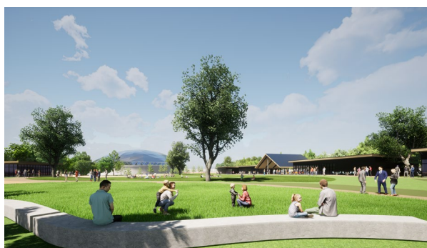
芝生広場イメージパース