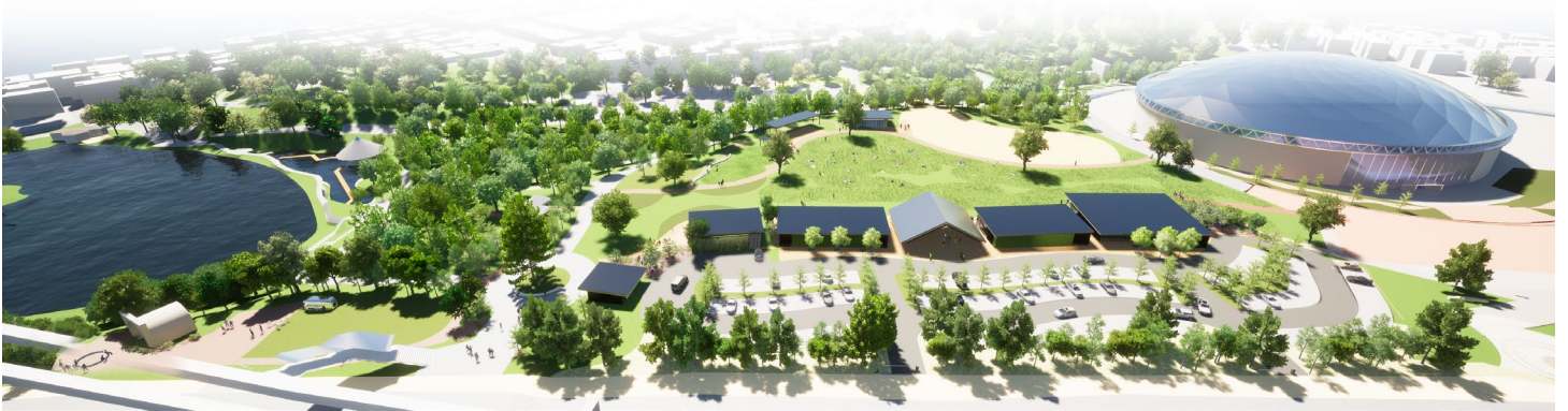
千葉公園 賑わいエリア(芝庭) 全景イメージパース ※イメージであり実際とは異なる場合があります。