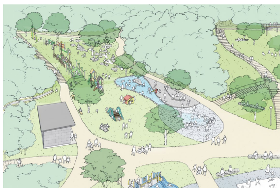
じゃぶじゃぶ池・山登りの路エリア