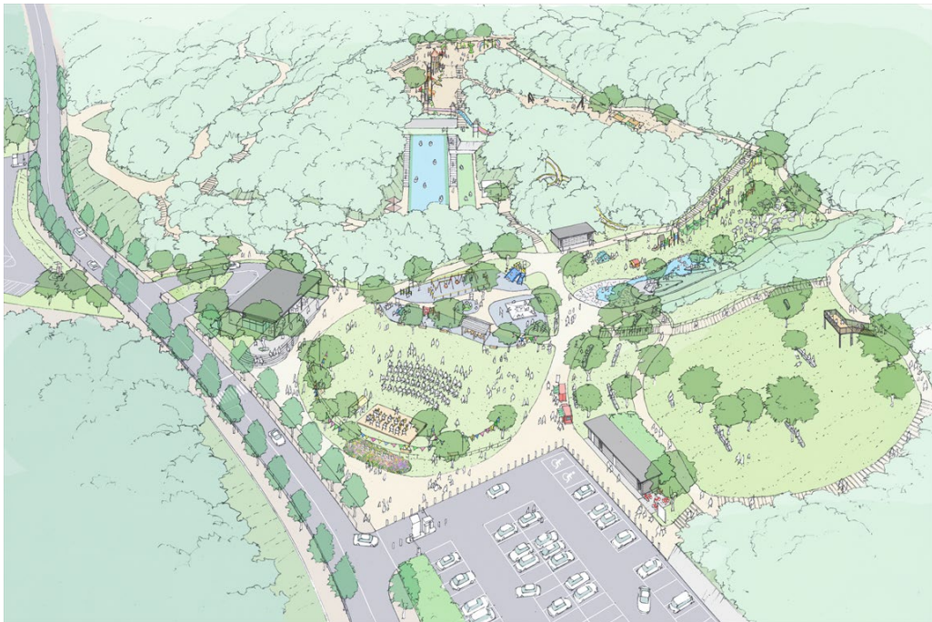
東平尾公園(大谷広場)全景イメージパース ※イメージであり実際とは異なる場合があります。