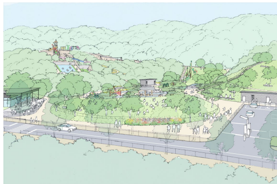
エントランスエリア