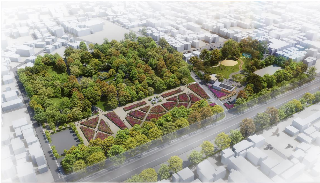
公園全景イメージパース(左側エリア:バラ園など、右側エリア:カフェなど) ※イメージであり実際とは異なる場合があります。