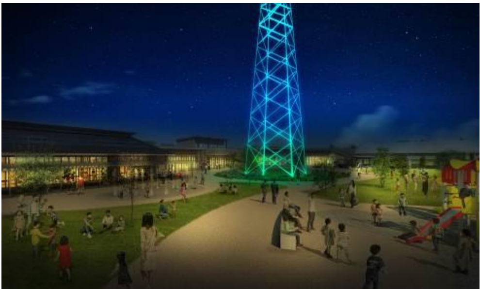
敷地内の鉄塔ライトアップ