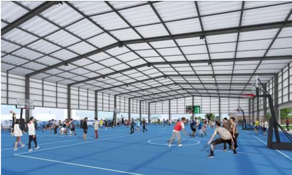
多目的広場(屋根付き)