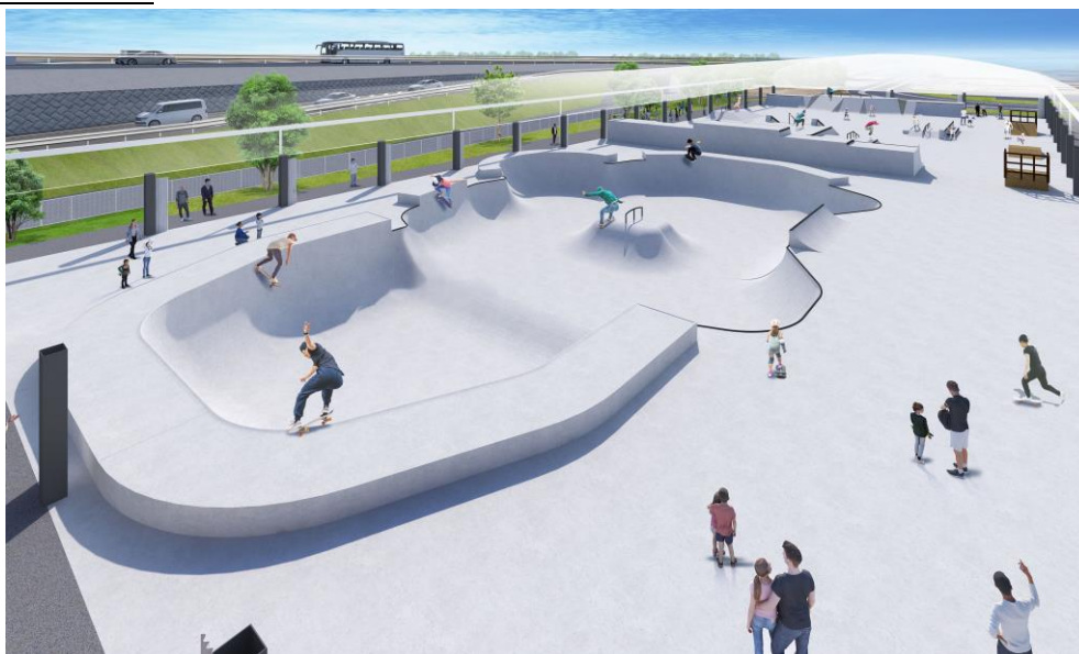
スケートパーク(屋根付き)