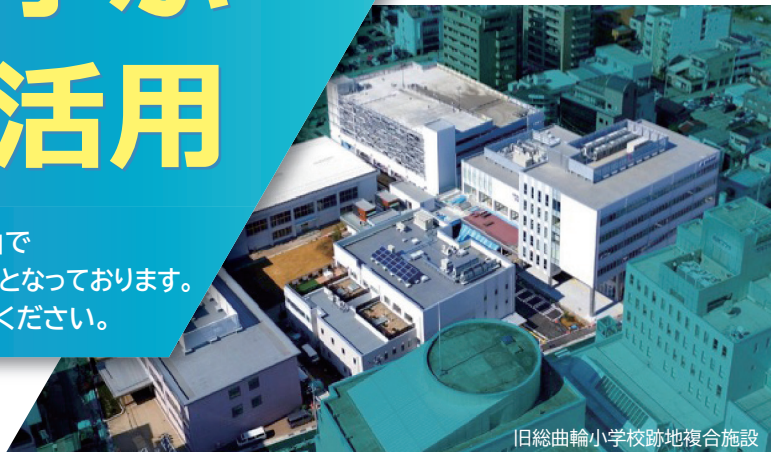
旧総曲輪小学校跡地複合施設