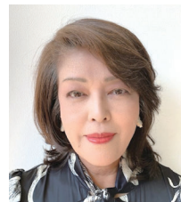
特定非営利活動法人 全国認定こども園協会 代表理事 社会福祉法人浄元福祉会 理事長