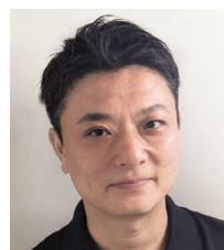
社会福祉連携推進法人 あたらしい保育イニシアチブ 理事 学校法人正和学園 理事長