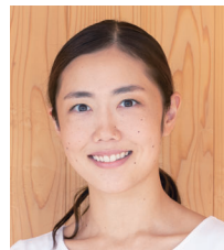
学校法人東谷学園 理事長